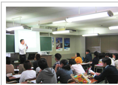
10/18 名古屋市内の国際観光専門学校にて、金融トラブル防止セミナーを実施