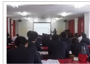
10/18 沖縄県内のSOLA沖縄学園にて、家計管理に関するセミナーを実施