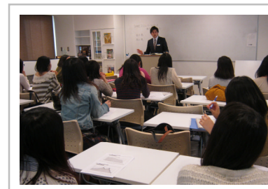
10/28 都内のホスピタリティツーリズム専門学校にて、家計管理セミナーを実施