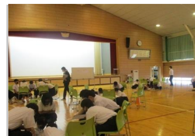
07/9_珠洲市立緑丘中学校_生活設計・家計管理セミナー (金沢プラザ/対面型)