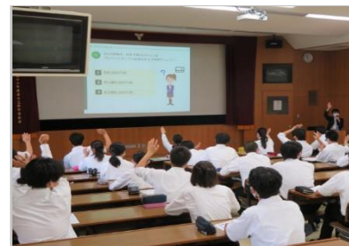
07/15_京都府立菟道高等学校_ローン・クレジット、生活設計・家計管理セミナー (梅田プラザ/対面型)