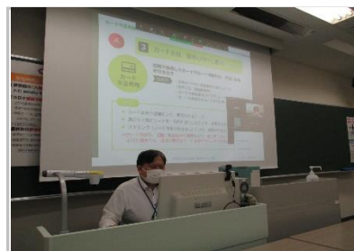
07/5_学校法人産業能率大学_ローン・クレジットセミナー (新宿プラザ/リモート型)